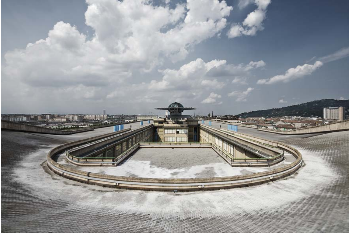
Agnelli Torino © Jorge Conde