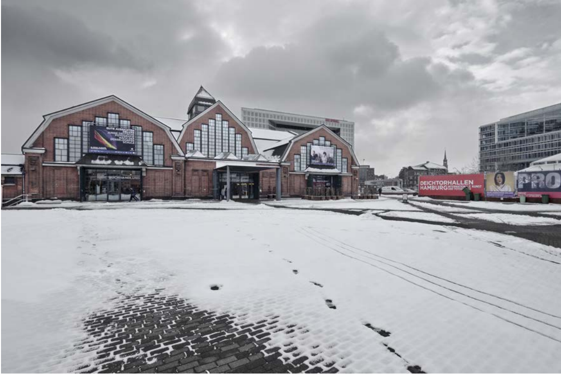
Deichtorhallen © Jorge Conde